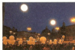
カンパニー・デ・キダム 《エルペールの夢》 © die des Quidams +写真は過去に別の町で行った 同パフォーマンスです。