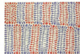
ミチエリ・ナバルラ『ワティヤ・チュタ』1999年 127 × 185.4cm アクリル、カンヴァス 個人蔵 © the artist 2009 licensed by Aboriginal Artists Agency

鮮やかな青と赤で描かれた葉模様のパターンは、神話的な力に満ちている。70年代初めに描き始められた、オーストラリア先住民による現代絵画。その中から一般初公開の選りすぐり14点が見られる。